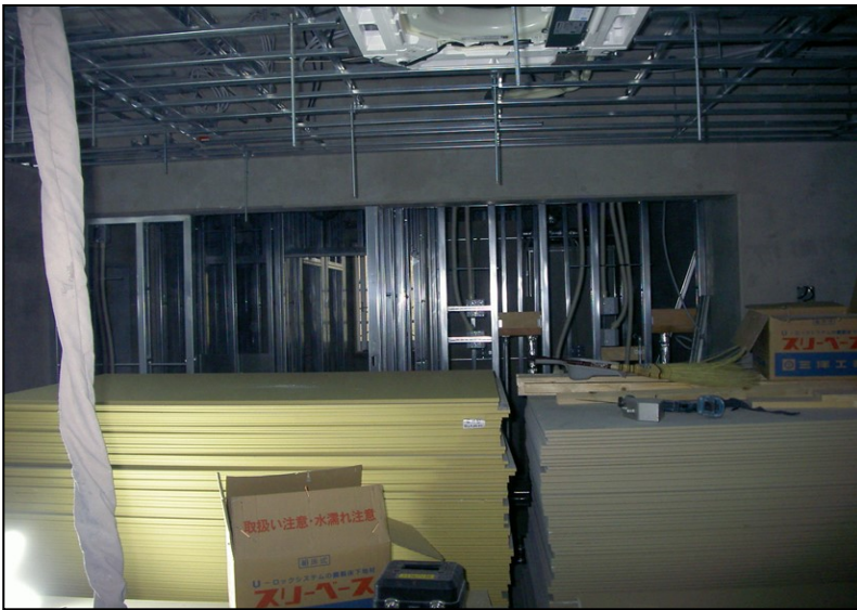
位置: 3F 水廻り室 撮影日: 令和3年11月1日 仕上ユニット工事: 鋼製床工事 設備工事: 床下配管工事