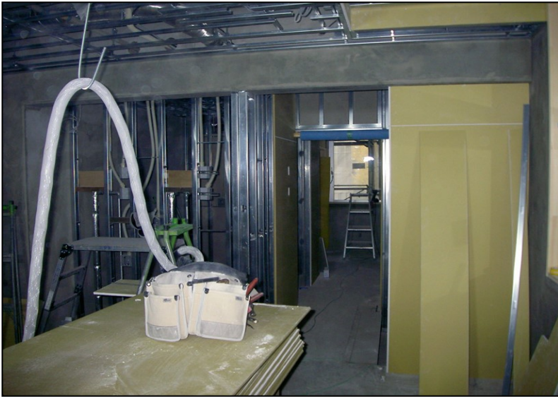
位置: 2F 水廻り室 撮影日: 令和3年11月1日 内装工事: 壁ボード張