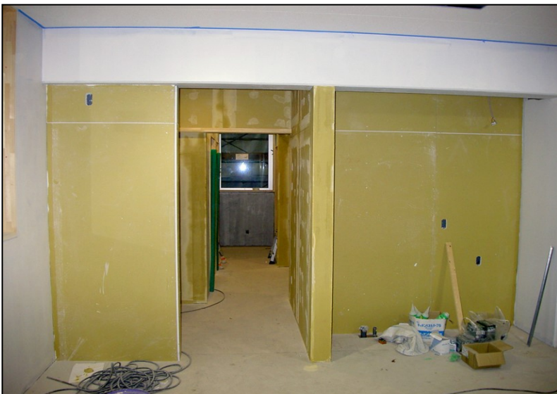
位置: 1F 水廻り室 撮影日: 令和3年11月1日 塗装工事: 壁ボード下地処理