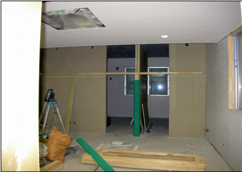
位置: 1F 交流スペース 撮影日: 令和3年11月1日