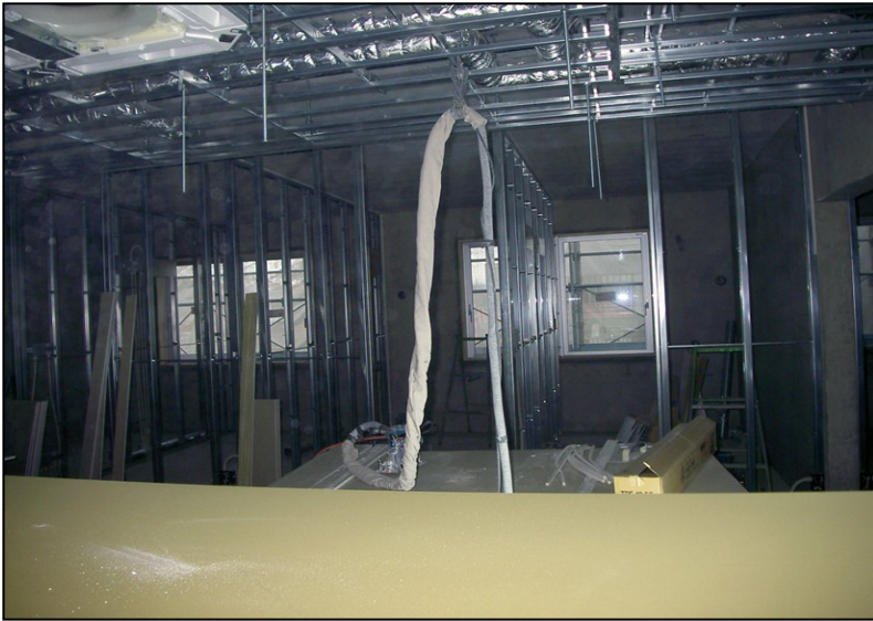
位置: 3F 交流スペース 撮影日: 令和3年11月1日