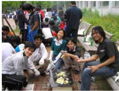
炊飯を楽しむ外国人留学生