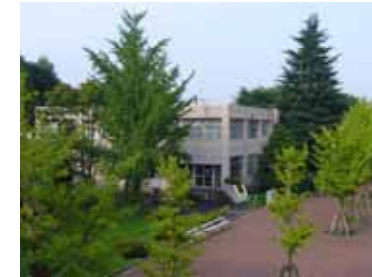
保健室(福利厚生会館)