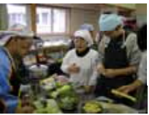
学生相談室主催の料理教室