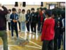
ミニロボコンin田面木小学校