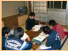
寺子屋 指導寮生による 学習支援